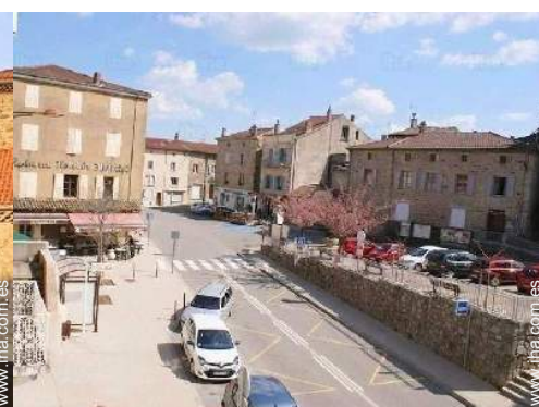
vista desde le piso