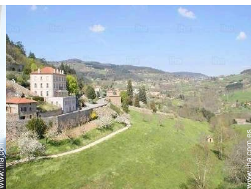
vista desde el dormitorio