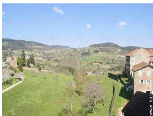
vista desde el dormitorio