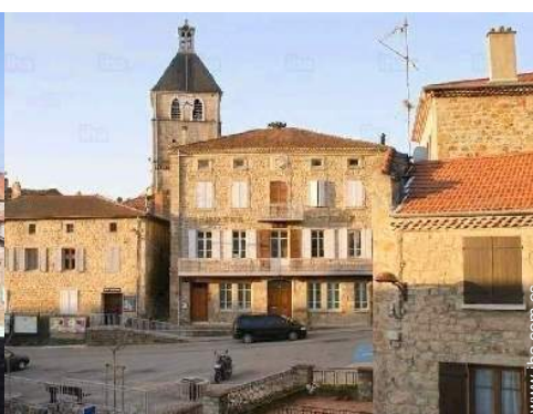
vista desde la cocina