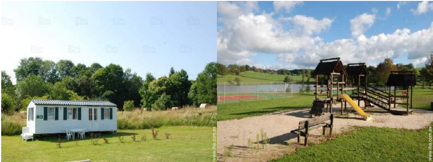
actividades balnearias cercanas