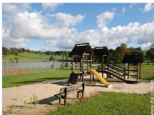
actividades balnearias cercanas