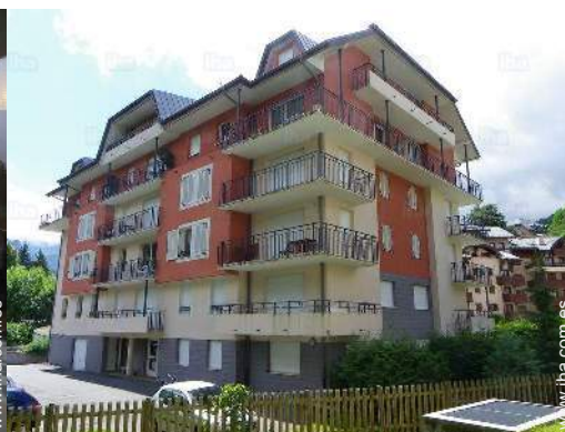
Residencia de lujo