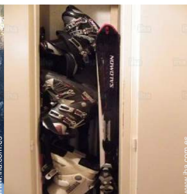
local de esquí