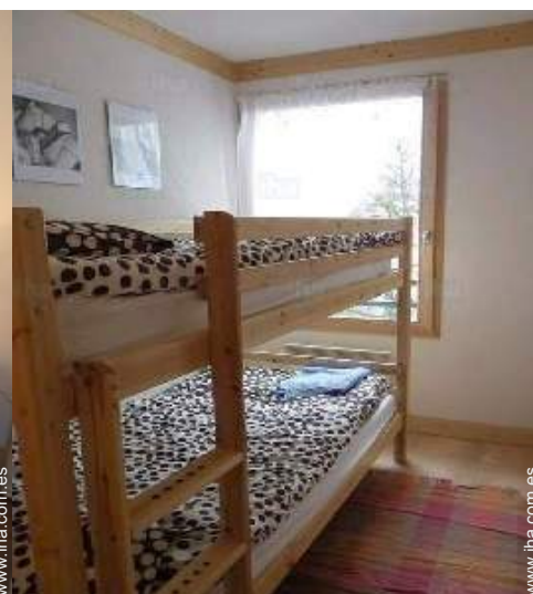
área de descanso