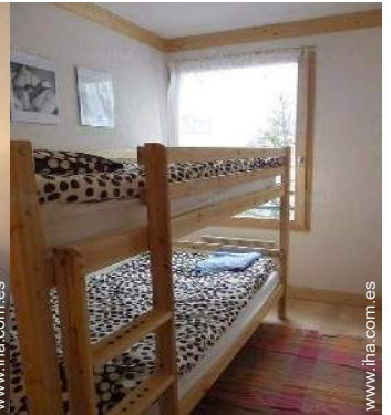
área de descanso