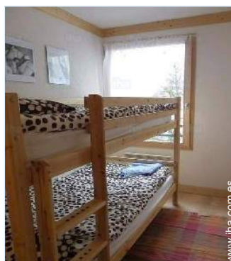
área de descanso