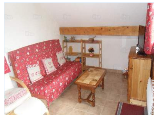
sofá cama 2 pers