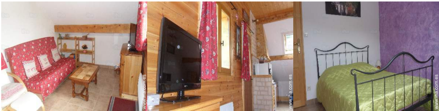
sofá cama 2 pers