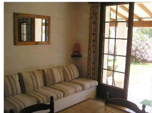
cuarto de estar