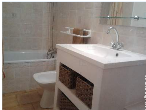
cuarto de baño