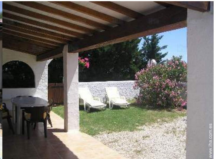
vista desde la terraza cubierta