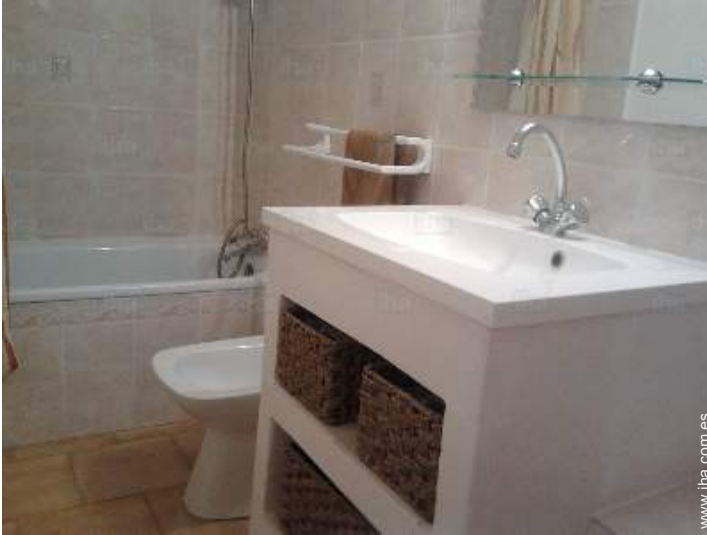
cuarto de baño