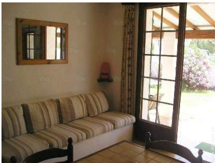
cuarto de estar