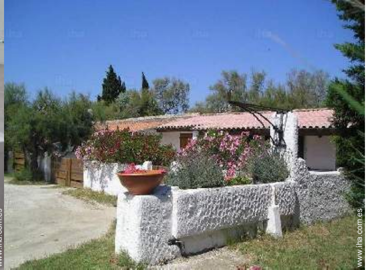
vista de la propiedad