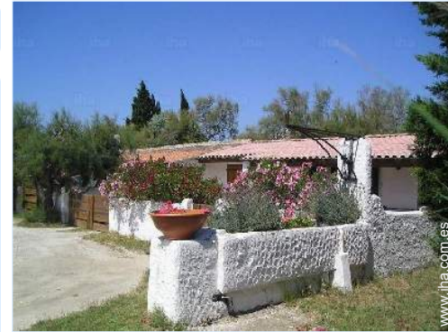
vista de la propiedad