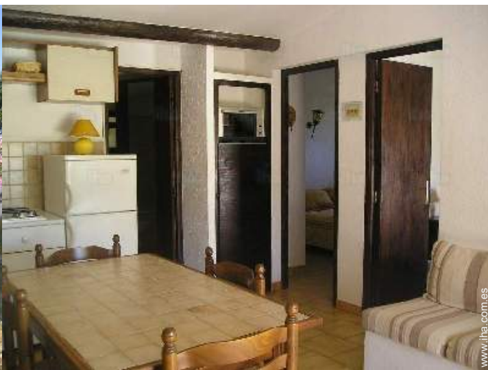
área de cocina