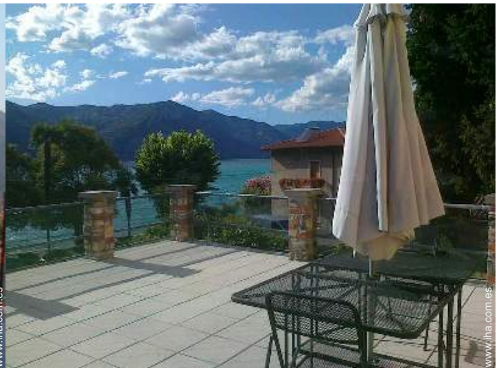
vista desde la terraza