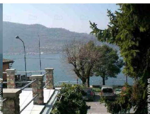
vista desde le piso