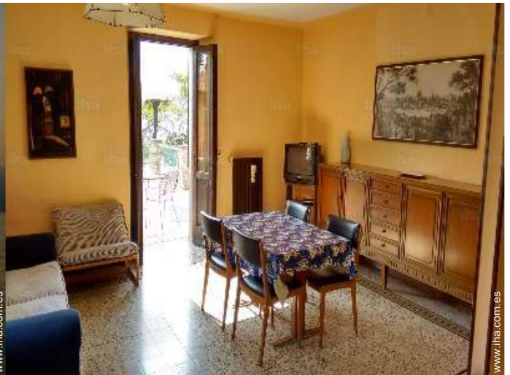
sala de televisión