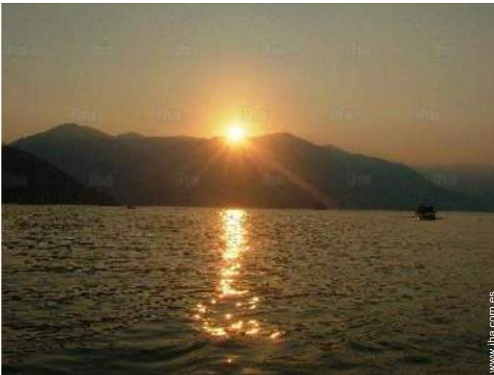
vista sobre la apuesta del sol