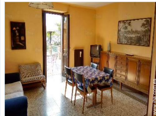
sala de televisión

Centro del pueblo 500m Panadería 300m Pequeños comercios 300m Supermercado 300m Peluquería 300m Correos 300m Banco 300m Farmacia 800m Médico 500m Hospital 7,5km Dispensario 800m