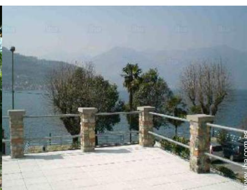
vista desde el cuarto de estar