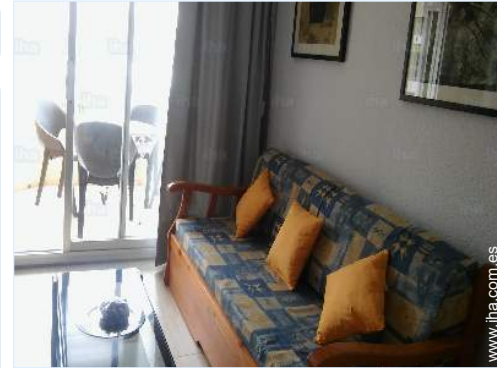
sofá cama 2 pers