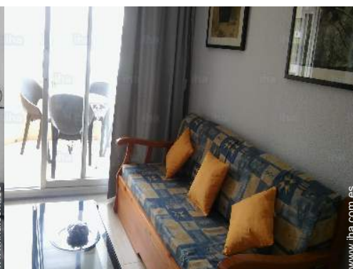
sofá cama 2 pers