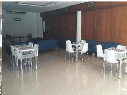
sala de juegos