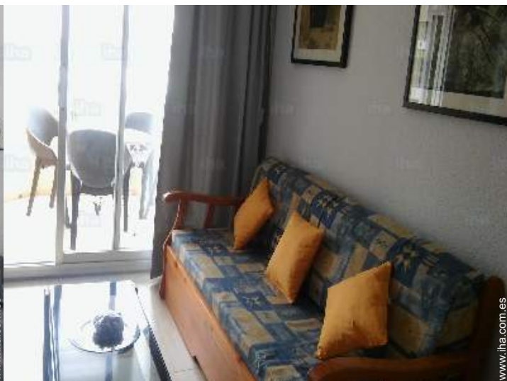
sofá cama 2 pers