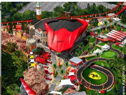
parque de atracciones