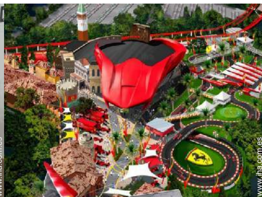
parque de atracciones