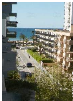
vista desde la terracea cubierta