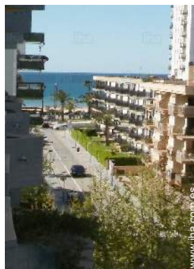
vista desde la terracea cubierta