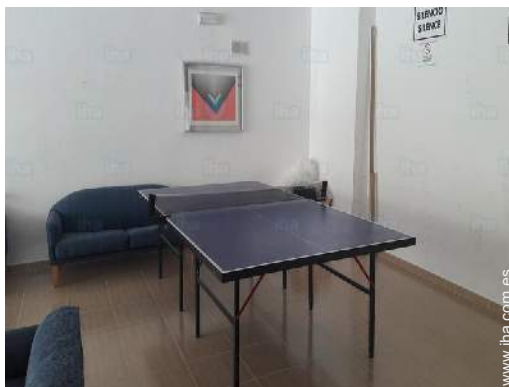
sala de juegos