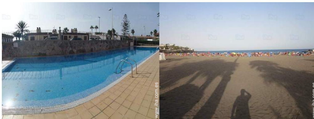
vista desde la piscina