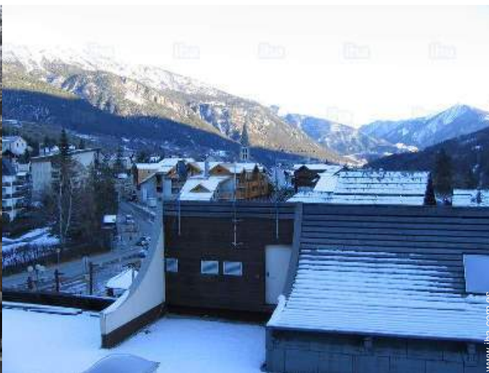
vista desde le piso