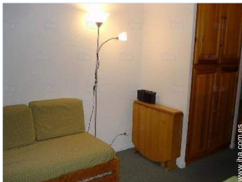
cama(s) mueble(s) 2 pers