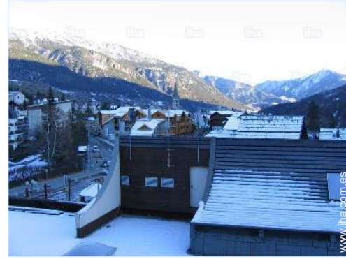
vista desde le piso