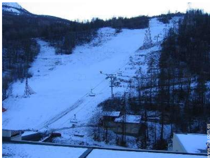
vista desde el balcón