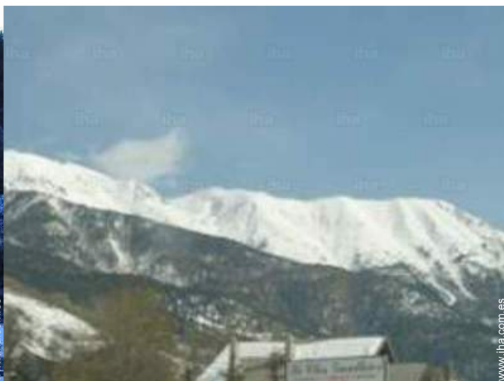
vista desde el balcón