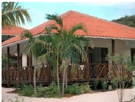
vista desde el jardin/parque