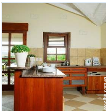
gran cocina americana