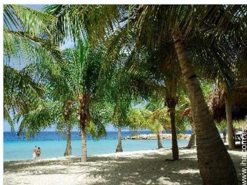
acceso directo playa