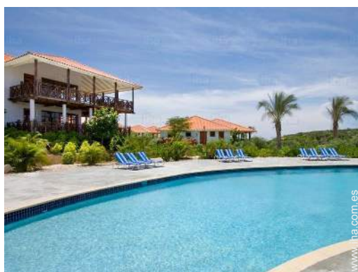
vista sobre la piscina