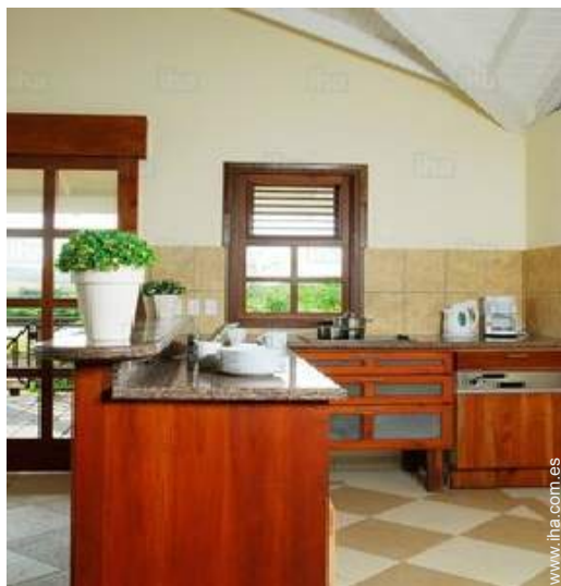
gran cocina americana