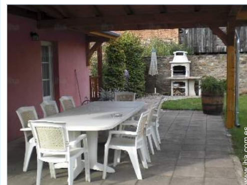
mesa(s) de jardin