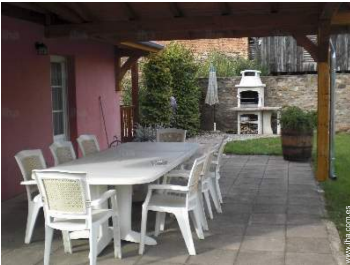
mesa(s) de jardin