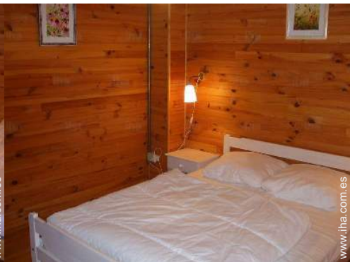
cuarto de invitados