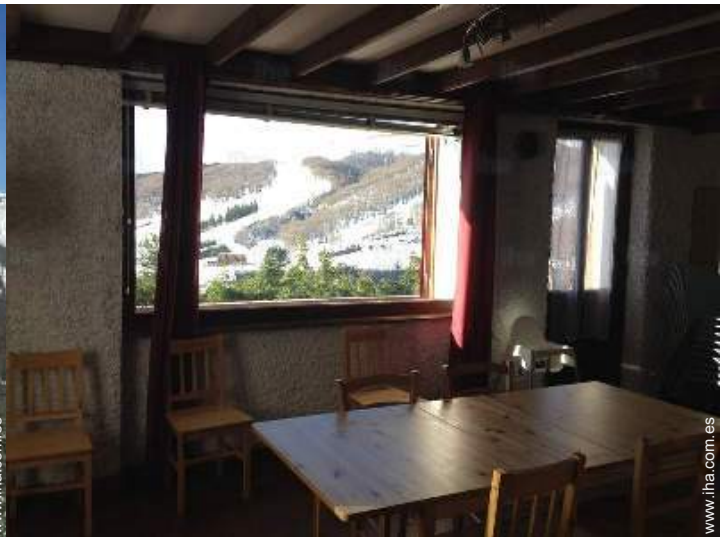
vista desde la casa