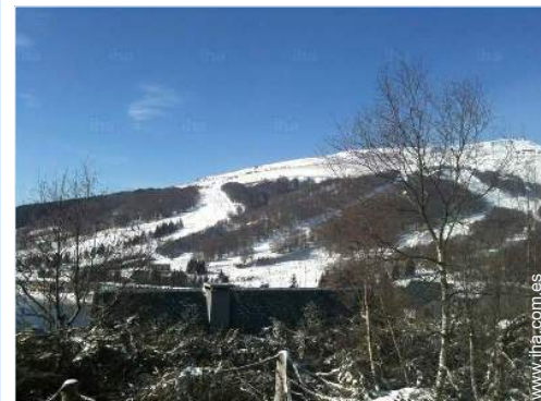
vista desde la casa