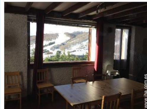
vista desde la casa

Guardería 500m Centro del pueblo 200m Parada/estación de autobús 300m Alquiler de bici/MTB 200m Alquiler de equipo de esquí 200m Alquiler de colada/lavandería 200m Panadería 200m Catering 200m Pequeños comercios 200m Peluquería 300m Correos 500m Banco 7,5km Cajero automático 200m Farmacia 500m Médico 500m