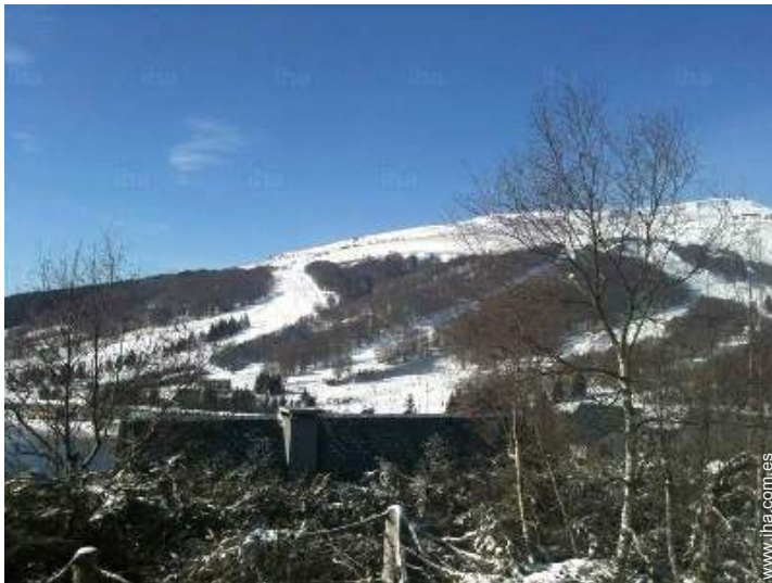
vista desde la casa