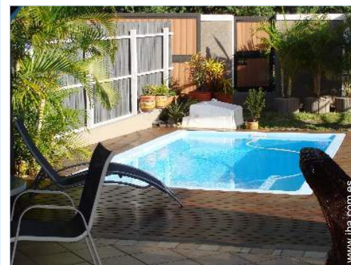
vista desde le comedor

Centro del pueblo 2km Parada/estación de autobús 1km Alquiler de moto/escúter 2km Alquiler de coche 2km Alquiler de barco 2km Alquiler de equipo de buceo 2km Pequeños comercios 2,5km Supermercado 3km Comercios de lujo y de marcas 4km Peluquería 3km Cibercafé 3km Correos 2,5km Banco 3km Cajero automático 2,5km Farmacia 3km Médico 3km Hospital 10km Dispensario 4km