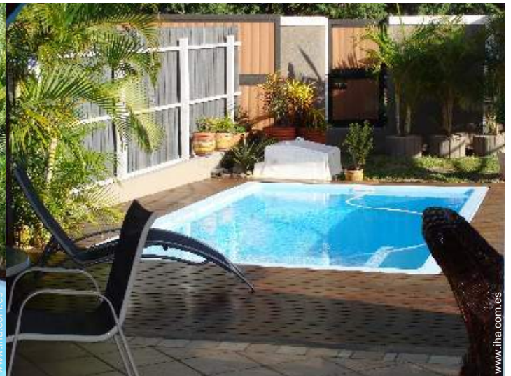
vista desde le comedor