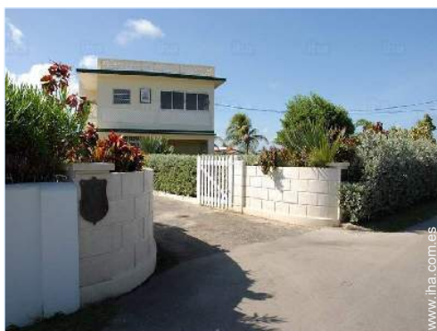
Residencia de lujo