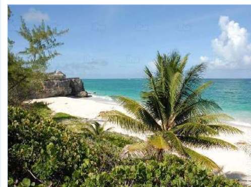
acceso directo playa