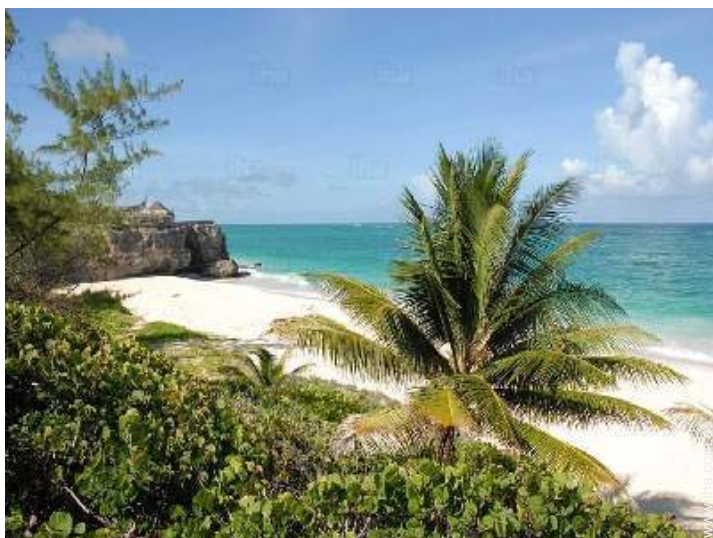
acceso directo playa