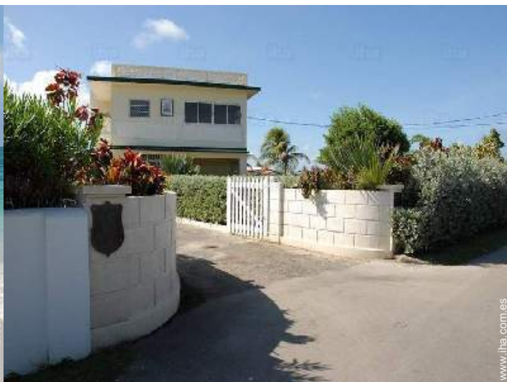
Residencia de lujo