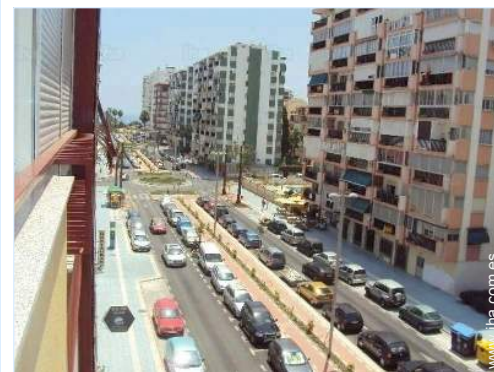
vista sobre la calle/la avenida

Centro del pueblo 300m Parada/estación de autobús 100m Tranvías 300m Correspondencia autobús playa <50m Alquiler de bici/MTB 200m Alquiler de moto/escúter Alquiler de coche 100m Alquiler de colada/lavandería <50m Panadería 100m Catering 100m Pequeños comercios <50m Supermercado 100m Peluquería 100m Cibercafé 50m Correos <50m Banco 50m Cajero automático <50m Farmacia 100m Médico 200m Hospital 800m