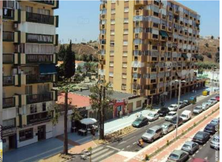
vista sobre la calle/la avenida