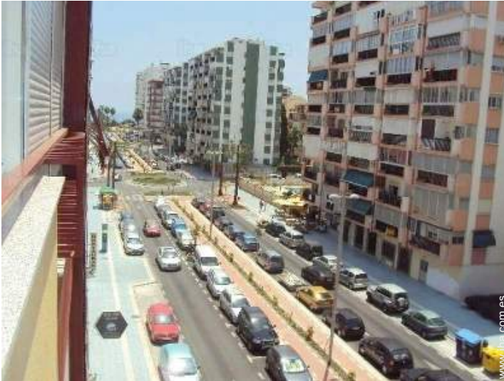
vista sobre la calle/la avenida