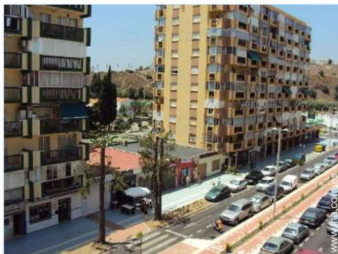
vista sobre la calle/la avenida