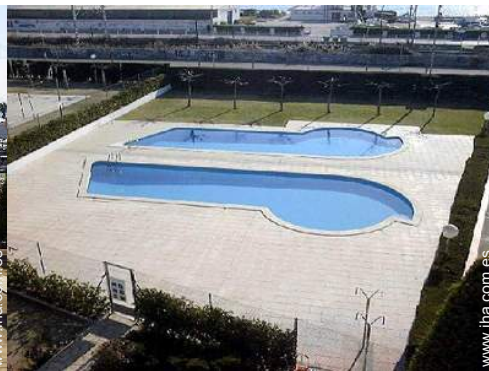
piscina en la residencia