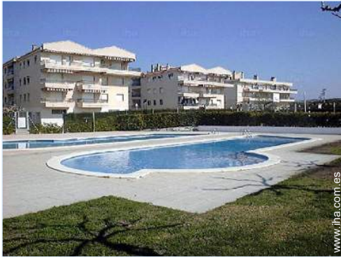
vista desde la piscina