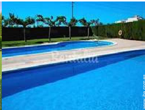
vista sobre la piscina