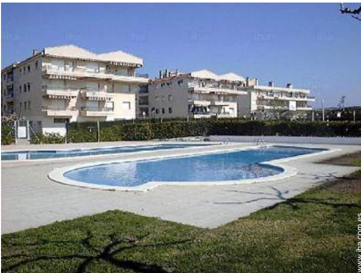
vista desde la piscina