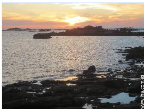
vista sobre la apuesta del sol