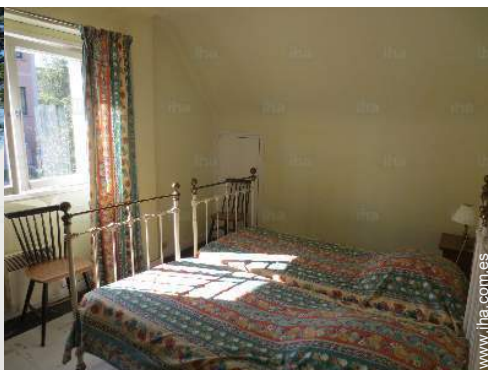
cuarto de invitados