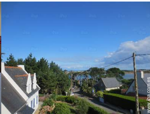
vista desde el dormitorio