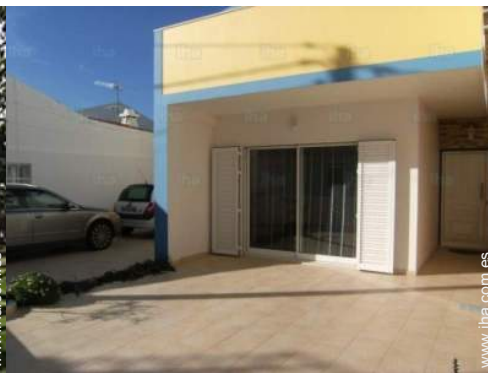
vista desde el salón