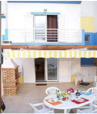
vista desde la terraza