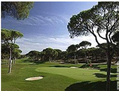
recorrido de golf 18 hoyos