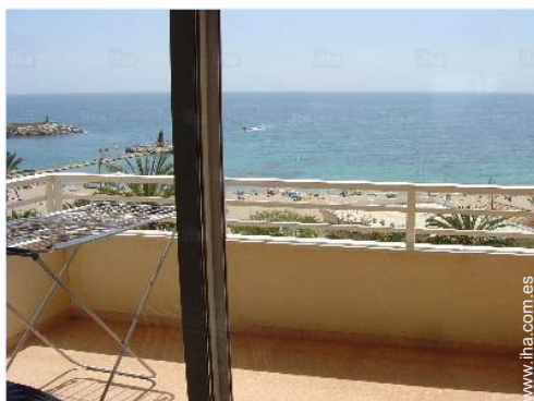
vista desde le piso