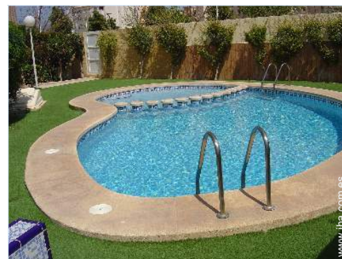
piscina en la residencia

El centro 1km Parada/estación de autobús 100m Alquiler de barco 100m Alquiler de equipo de buceo 200m Panadería 100m Pequeños comercios 100m Supermercado 100m Comercios de lujo y de marcas 5km Peluquería <50m Cibercafé 300m Correos 800m Banco 800m Cajero automático 800m Farmacia 300m Médico 1,5km Hospital 3km Dispensario 1,5km