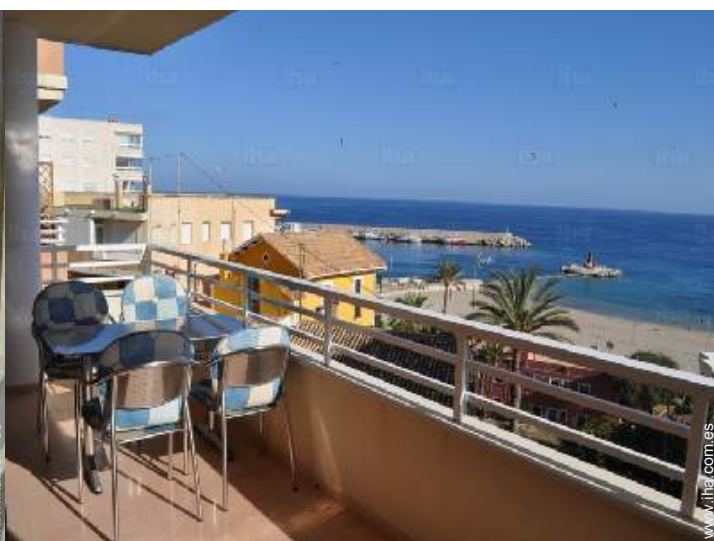
vista desde le piso