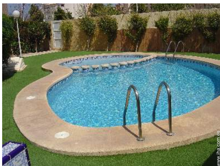
piscina en la residencia