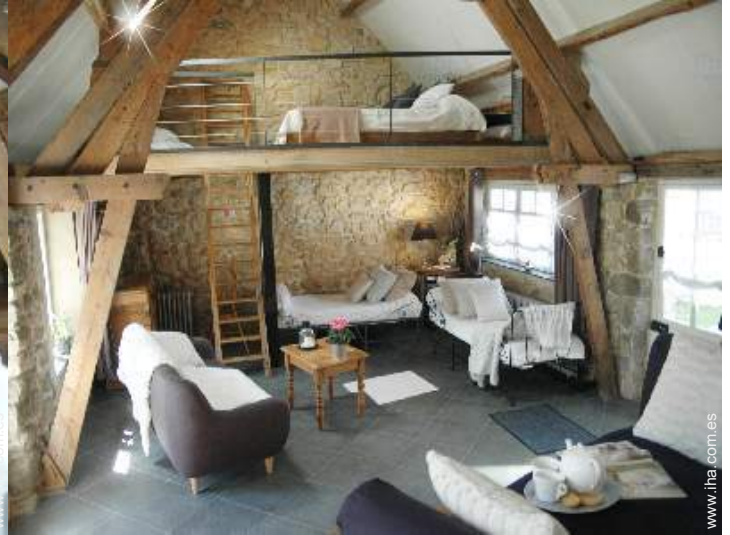
Propiedad con Encanto