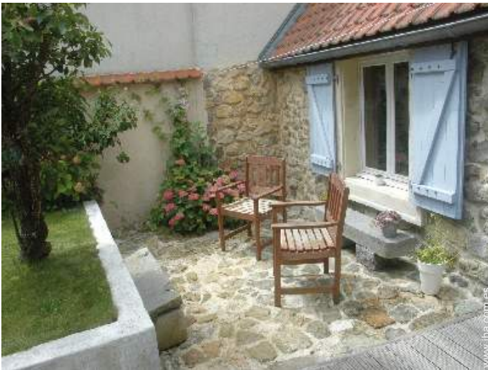
Casa de Piedra