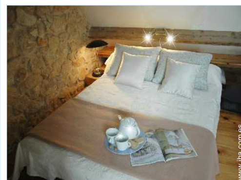
vista desde le entresuelo

Mar/océano 300m Playa de arena 300m Piscina pública 10km Pista de tenis pública 800m Anuncio de windsurf 300m Acantilado 15km