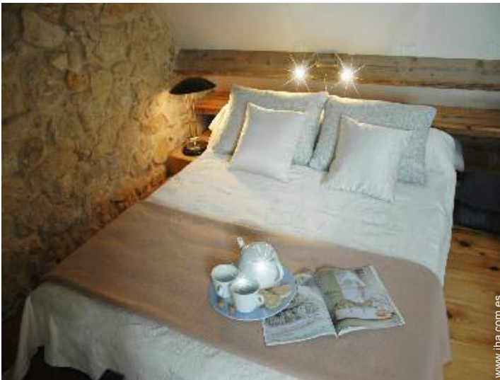
vista desde le entresuelo