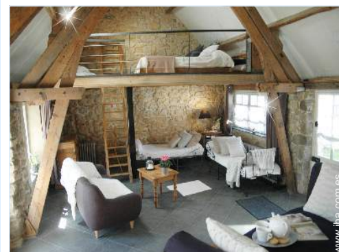
Propiedad con Encanto