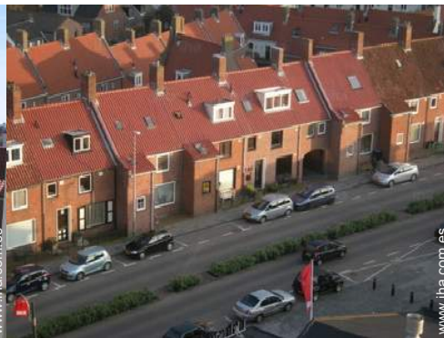
vista sobre las azoteas