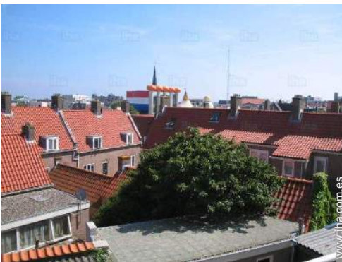
vista sobre el centro del pueblo