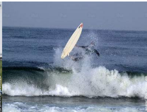
actividades náuticas cercanas