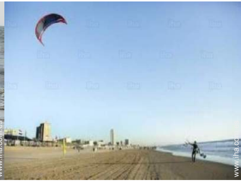
actividades náuticas cercanas