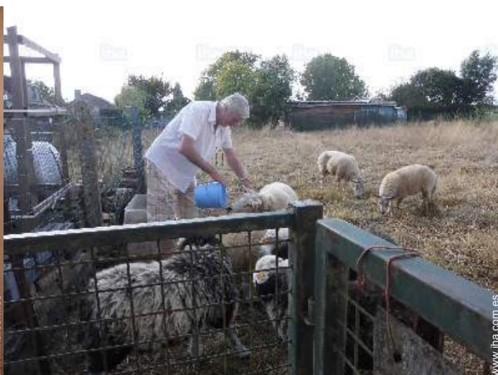
vista sobre campos agrícolas