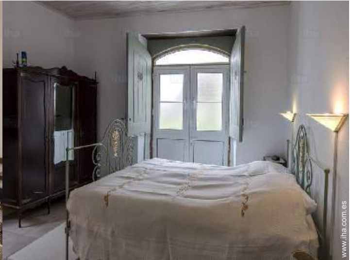
cama de matrimonio