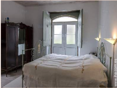
cama de matrimonio