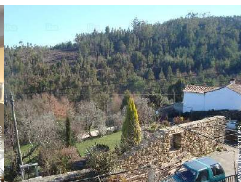
vista desde la casa