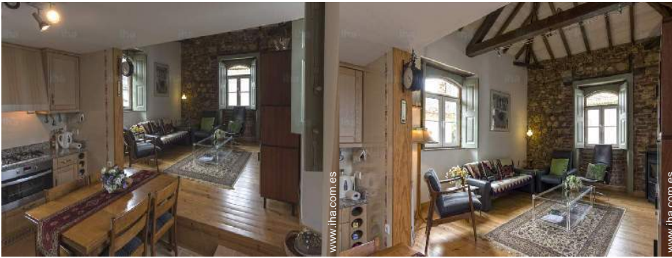
Disposición interior privado