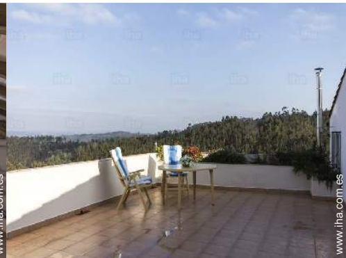
vista sobre el bosque