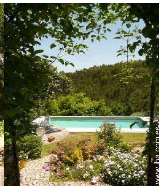
vista sobre la piscina