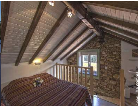
cuarto de invitados