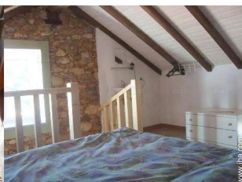
cuarto de invitados