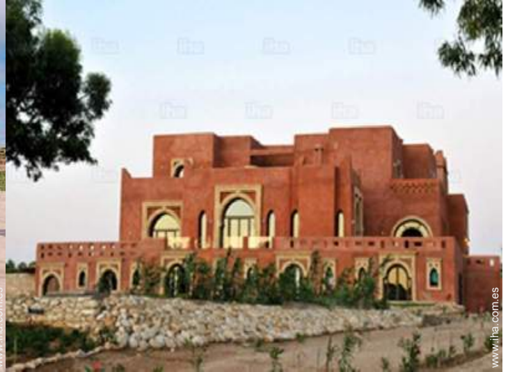
Casa Típica con Encanto