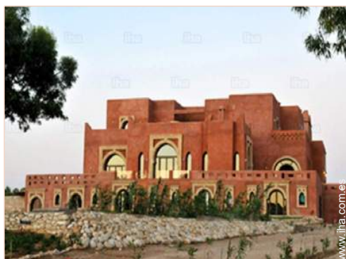
Casa Típica con Encanto