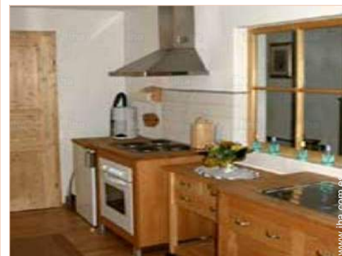
gran cocina independiente

Centro del pueblo 200m Parada/estación de autobús 200m Alquiler de bici/MTB <50m Alquiler de coche 5km Alquiler de barco 20km Panadería 300m Catering 300m Pequeños comercios 300m Supermercado 5km Peluquería 300m Correos 5km Banco 300m Cajero automático 300m Farmacia 5km Médico 200m Hospital 20km Dispensario 5km