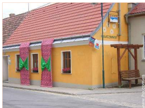
Casa de Campo con Encanto