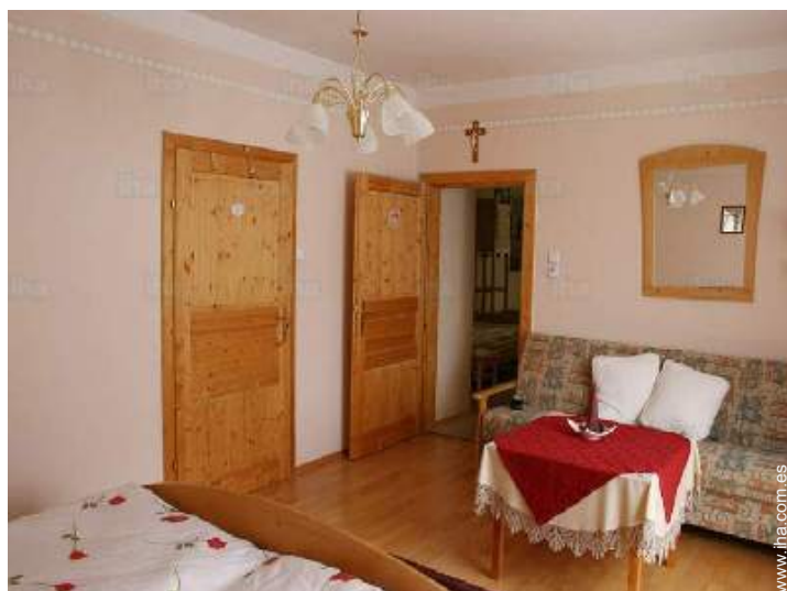
sofá cama 1 pers