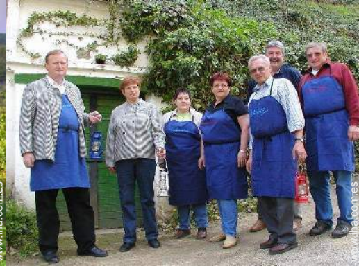
bodega y degustación de vino