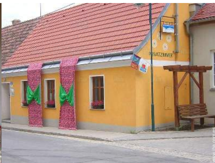
Casa de Campo con Encanto