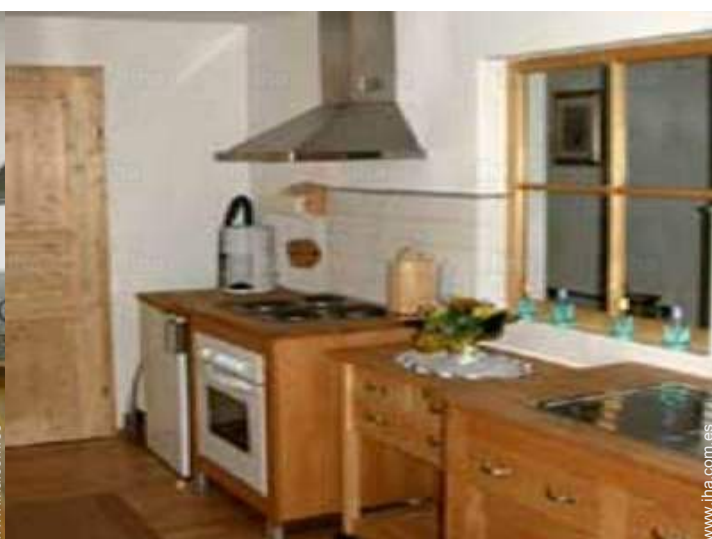
gran cocina independiente