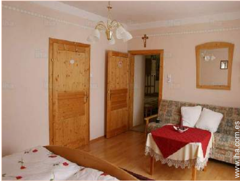
sofá cama 1 pers