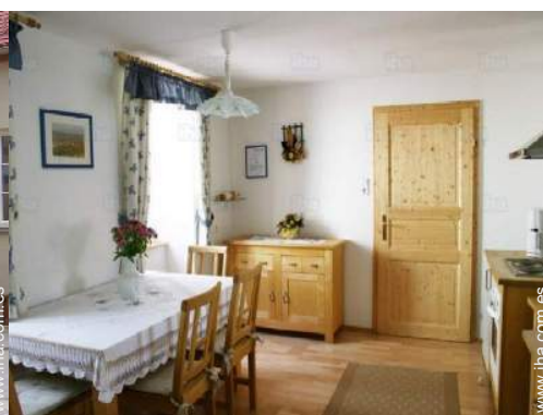
Casa de Campo con Encanto