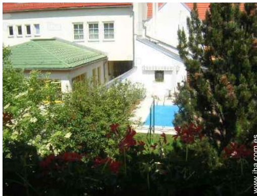
Propiedad con Encanto