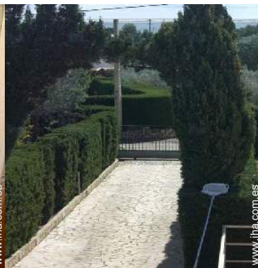
vista desde el balcón