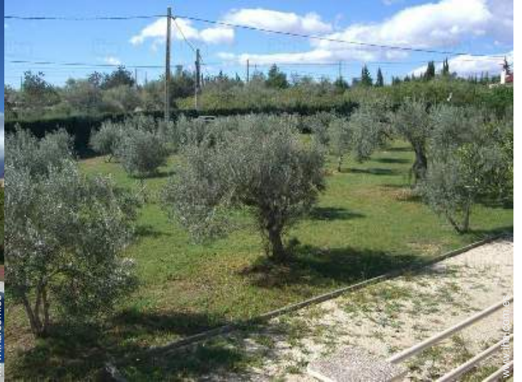
vista desde la terraza