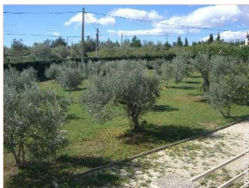
vista desde la terraza