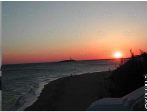
vista sobre la apuesta del sol