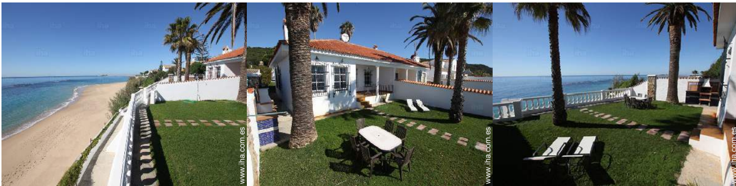
área de jardín