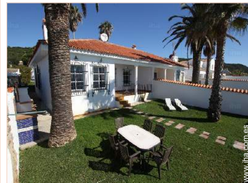
área de jardín