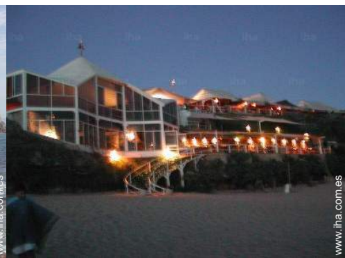
Instalaciones de ocio