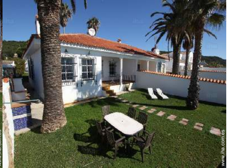
área de jardín