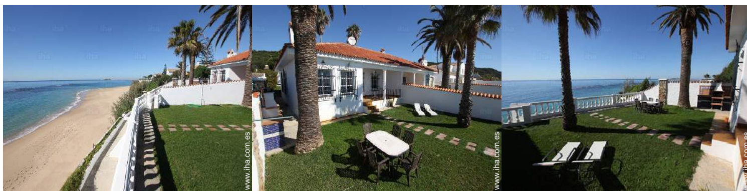
área de jardín