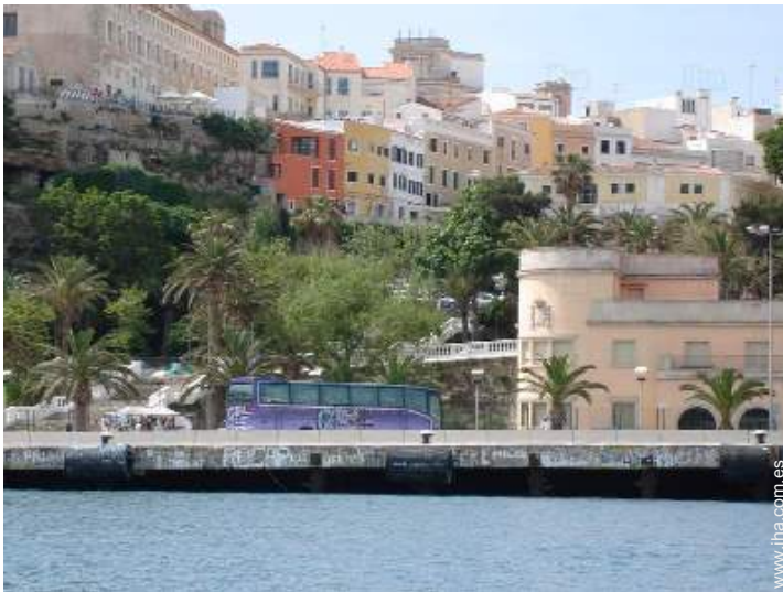
Casa con Encanto