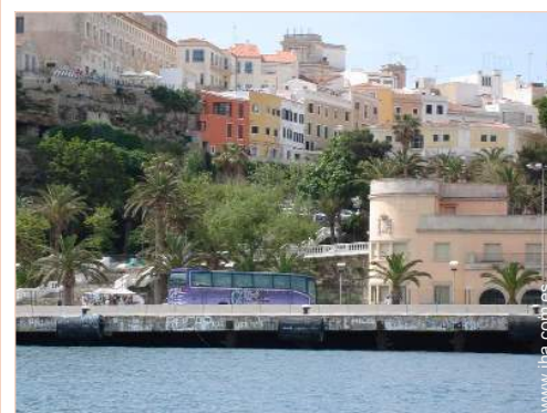
Casa con Encanto

El centro <50m Parada/estación de autobús 300m Alquiler de coche 200m Alquiler de barco 200m Panadería <50m Pequeños comercios <50m Supermercado <50m Peluquería 100m Correos 200m Banco <50m Cajero automático <50m Farmacia 50m Médico 200m Hospital 300m