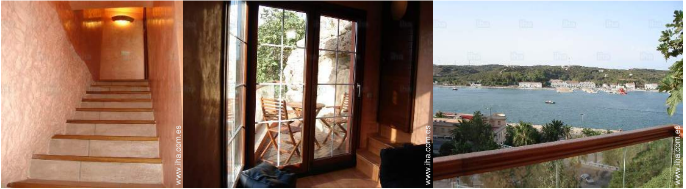
Propiedad con Encanto