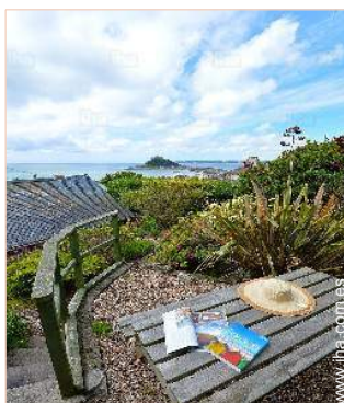
vista de la propiedad