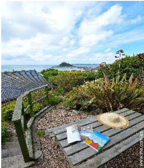
vista de la propiedad