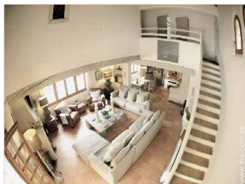
vista desde le comedor