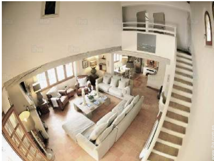
vista desde le comedor