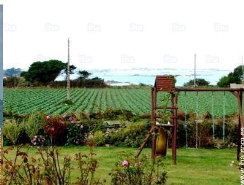
vista desde el jardín/parque