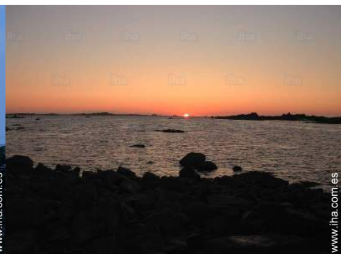
vista sobre la puesta del sol