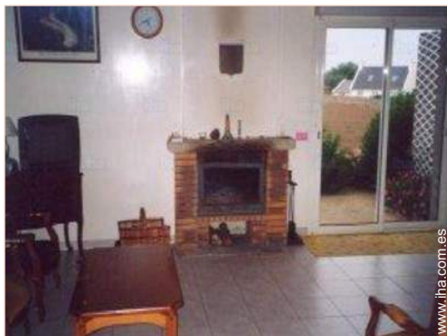
vista desde el salón