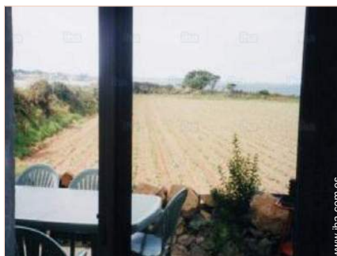
vista desde la terraza