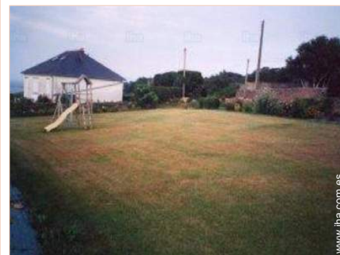
vista desde el jardín/parque

Banco 1,5km Cajero automático 1,5km Farmacia 1,5km Médico 1,5km Enfermera 1,5km Hospital 15km