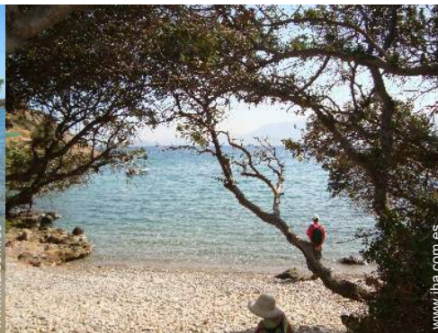
playa de roca