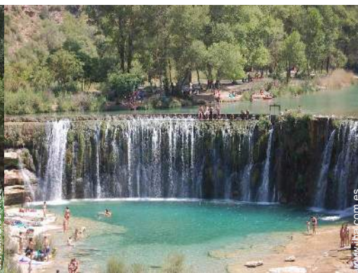
actividades de ocio de verano cercanas