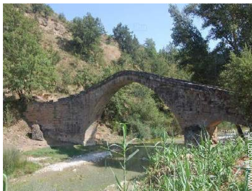
Zonas atractivas y relajación