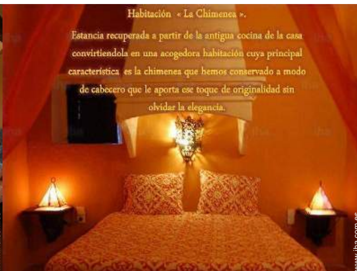
Habitación « La Chimenea ».

Estancia recuperada a partir de la antigua cocina de la casa convirtiéndola en una acogedora habitación cuya principal característica es la chimenea que hemos conservado a modo de cabecero que le aporta ese toque de originalidad sin olvidar la elegancia.