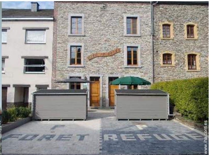
Marco exterior a disposición de los huéspedes