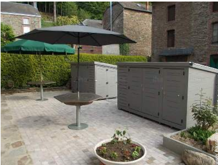
Instalaciones exteriores a disposición de los huéspedes