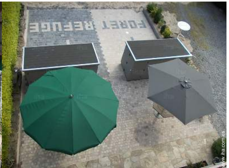
Instalación exterior a disposición de los huéspedes