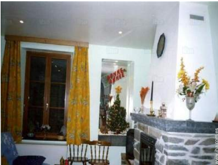
estufa de madera