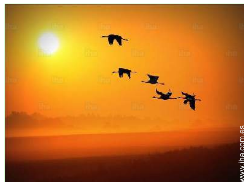
vista sobre campos agrícolas