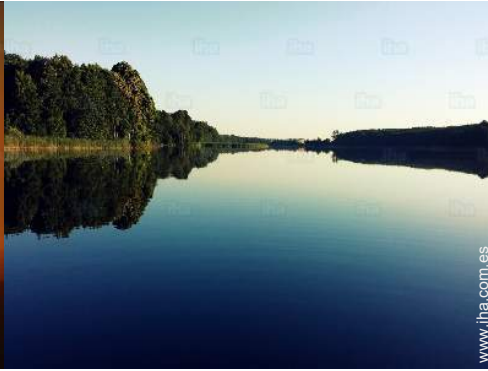
actividades balnearias cercanas