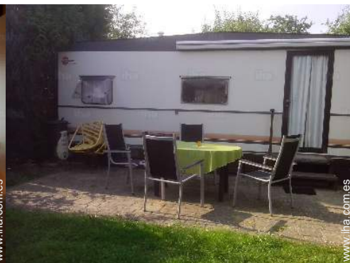
Instalación exterior a disposición de los huéspedes