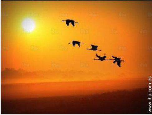
vista sobre campos agrícolas