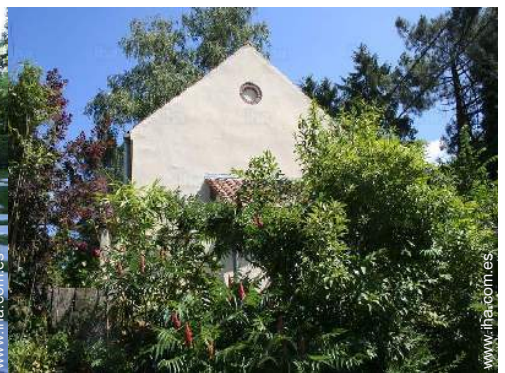
vista de la propiedad