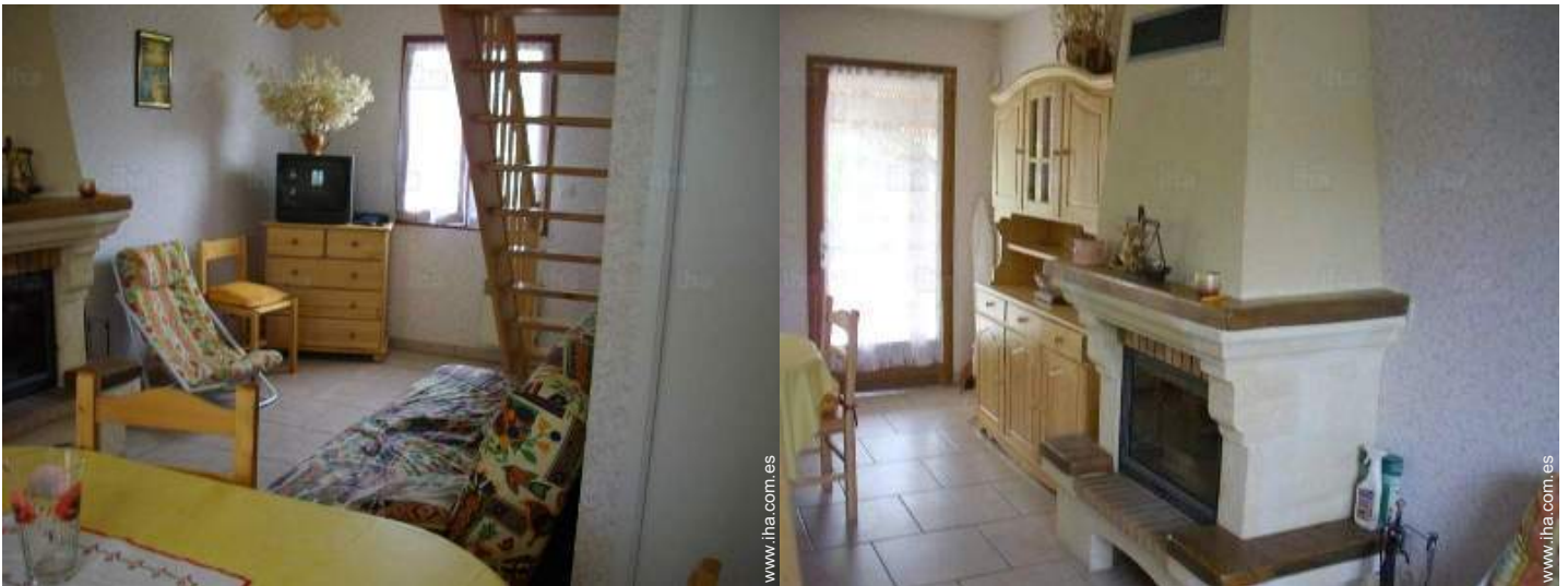
Disposición interior privado