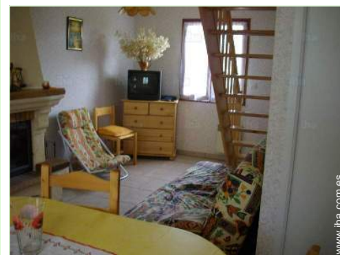
Disposición interior privado