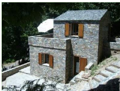
vista sobre la montaña