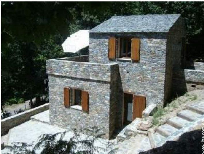
vista sobre la montaña