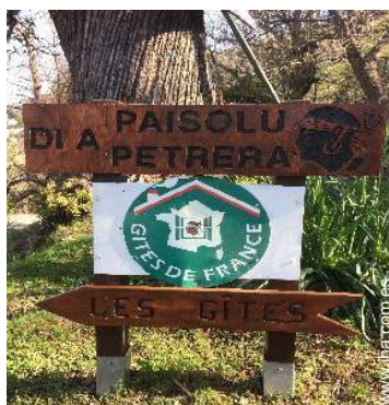
Presencia en el lugar