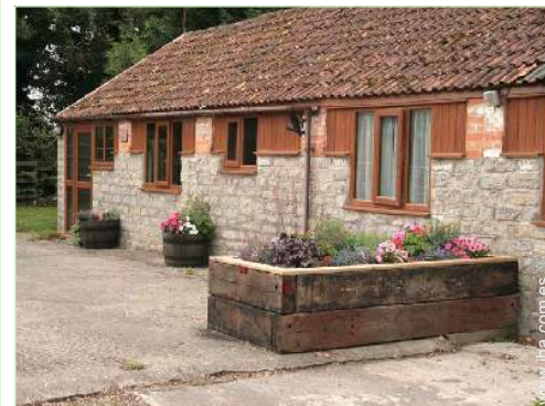
Cottage con Encanto