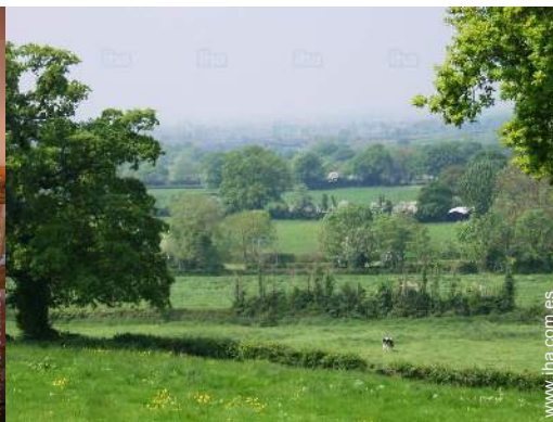
vista sobre el campo