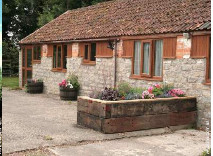
Cottage con Encanto