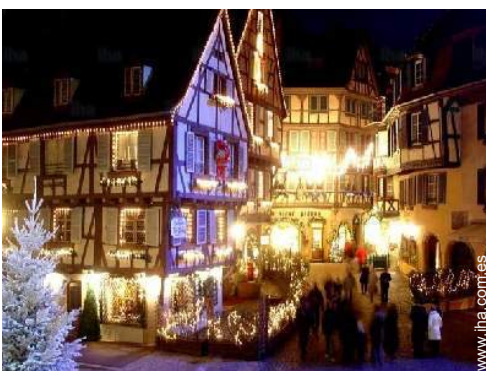
vista sobre el centro