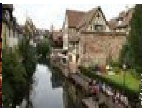
Piso con Encanto