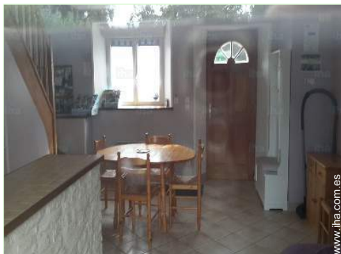
vista desde la cocina