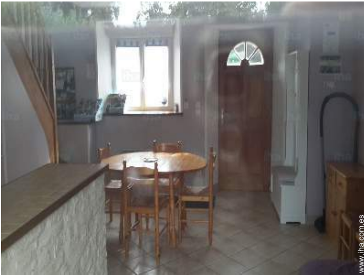
vista desde la cocina