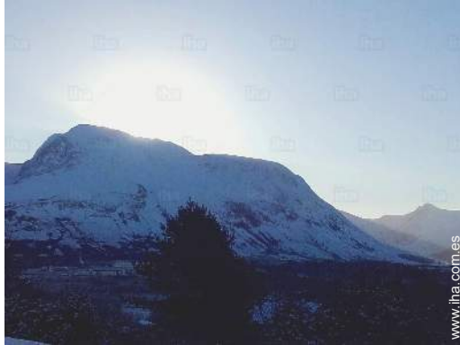
actividades de montaña cercanas