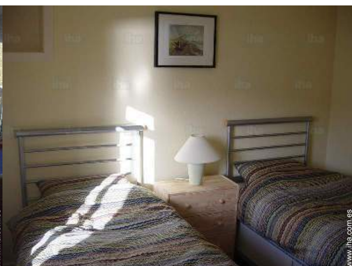
camas gemelas sencilla