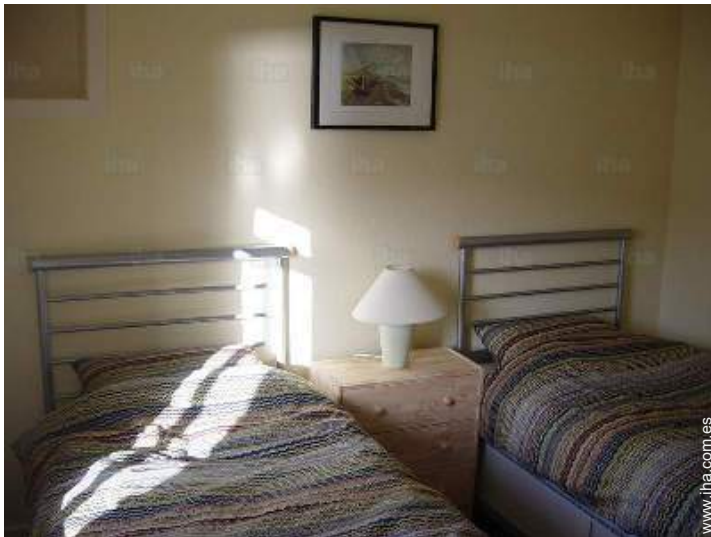
camas gemelas sencilla