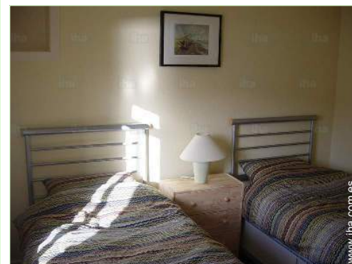
camas gemelas sencilla

Peluquería 300m Cibercafé 100m Correos 300m Banco 200m Cajero automático 200m Farmacia Médico Hospital 800m Dispensario