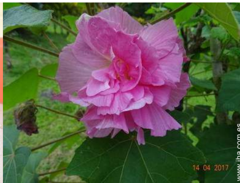
vista desde la terracea cubierta