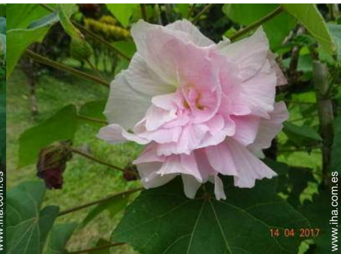
vista desde la terracea cubierta