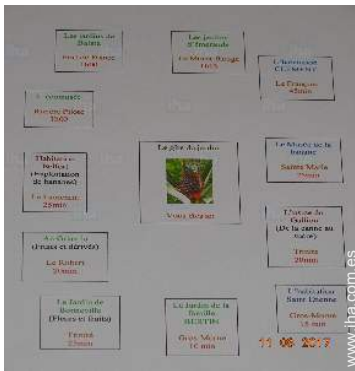
parque y jardín