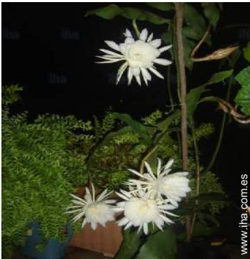
vista desde la terracea cubierta