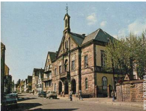
centro del pueblo