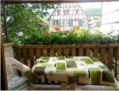
vista desde la terraza cubierta