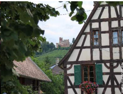
vista desde la terraza cubierta