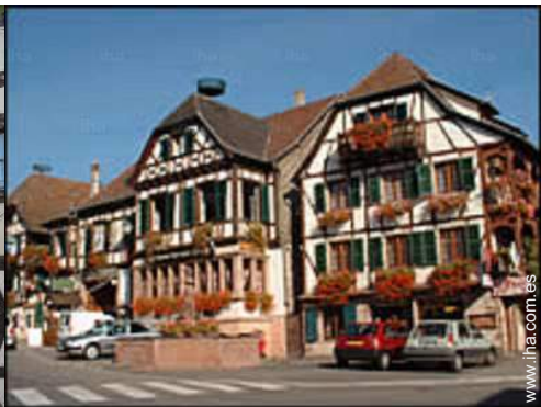
vista sobre el pueblo