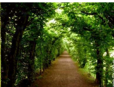
camino para pasear