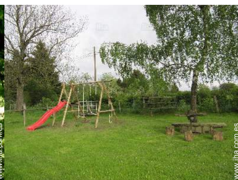
Instalaciones de ocio