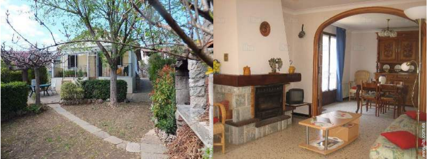
vista desde el salón