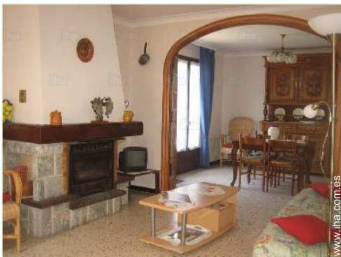
vista desde el salón