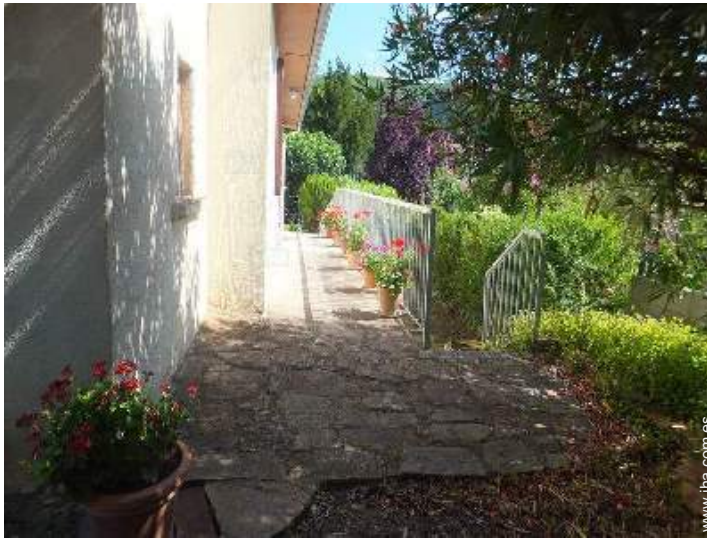
terreno de petanca