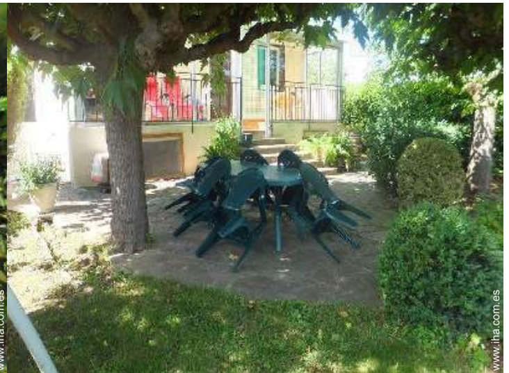
vista sobre el jardín/parque