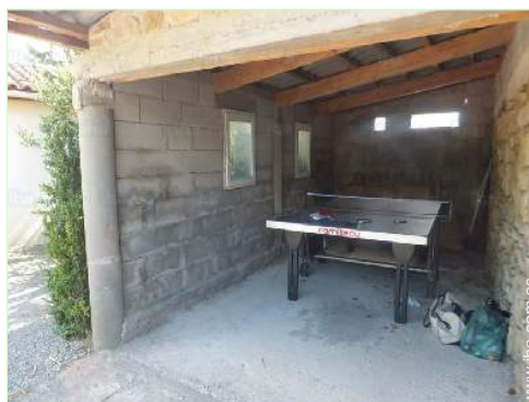
mesa de ping-pong