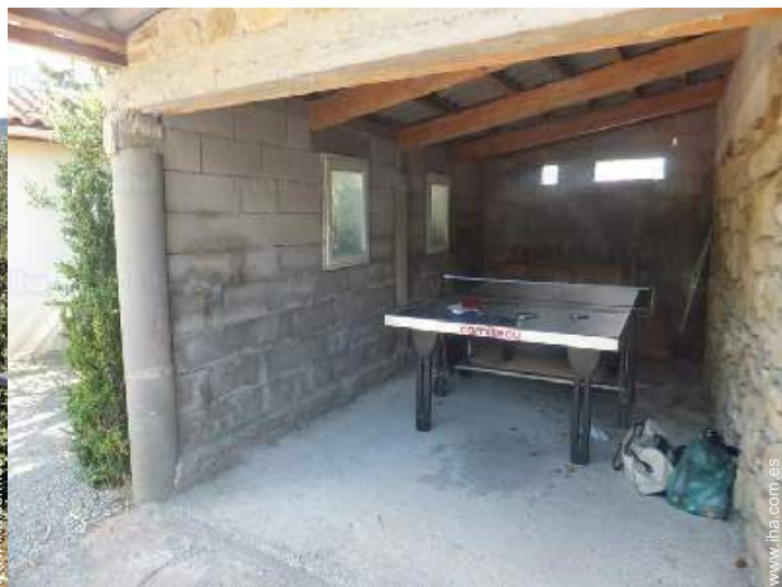
mesa de ping-pong