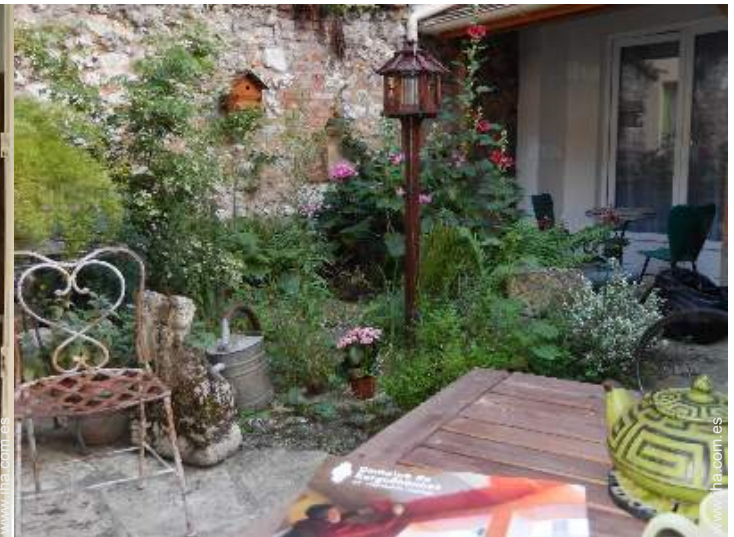
vista desde le piso