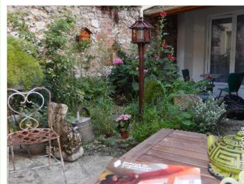
vista desde le piso

El centro <50m Panadería <50m Pequeños comercios <50m Supermercado 500m Peluquería 500m Correos 1km Banco 1,5km Cajero automático 1,5km Farmacia 500m Médico 2km Enfermera Hospital 25km