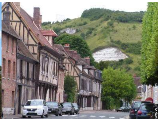
vista sobre el centro del pueblo