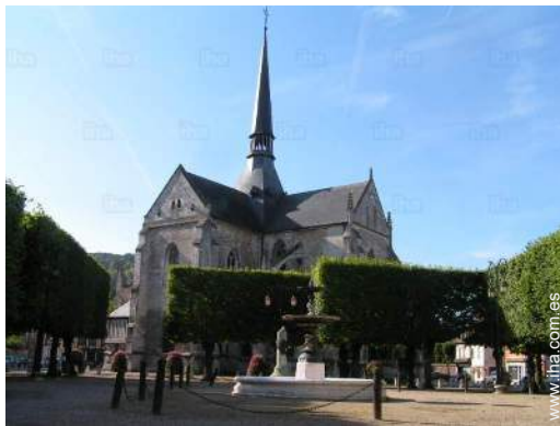
vista sobre el monumento