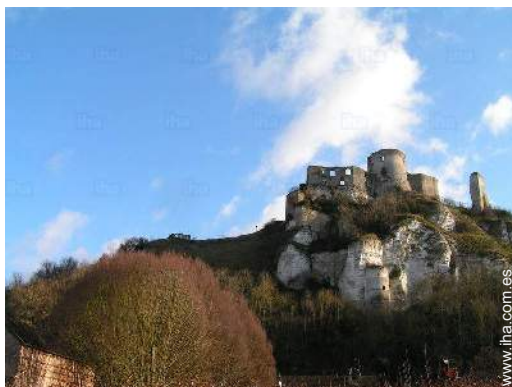
vista sobre el monumento