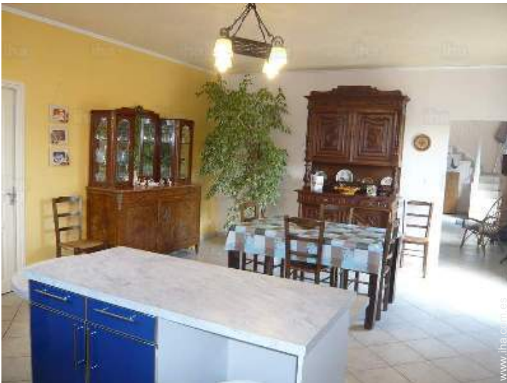
gran cocina independiente