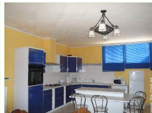
gran cocina independiente

Centro del pueblo <50m Panadería <50m Catering <50m Pequeños comercios <50m Supermercado 7,5km Comercios de lujo y de marcas 25km Peluquería <50m Correos <50m Banco <50m Cajero automático <50m Farmacia <50m Médico <50m Enfermera <50m Hospital 15km