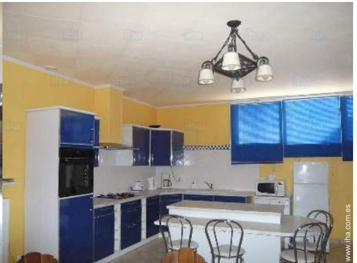
gran cocina independiente