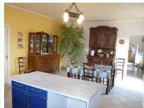
gran cocina independiente