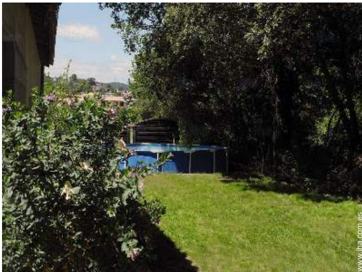
vista desde la piscina