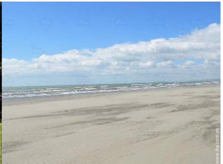
playa de arena