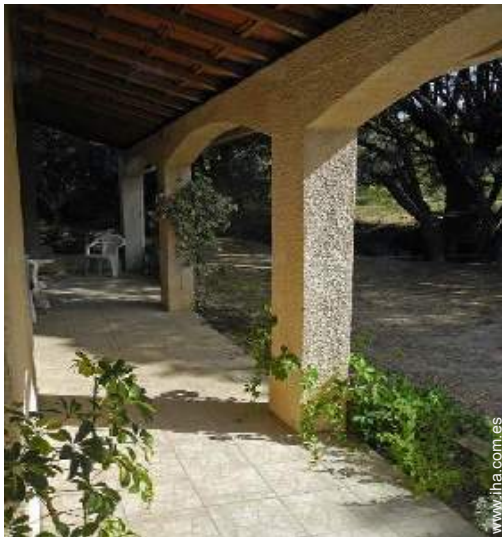
vista desde la terraza cubierta