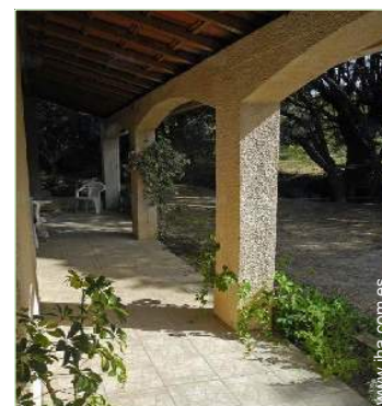
vista desde la terraza cubierta