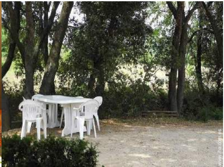
vista sobre el patio